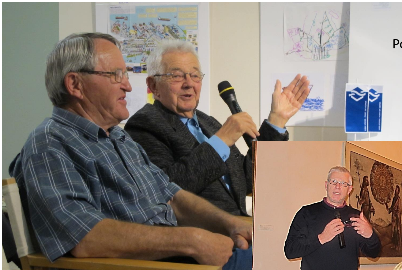
Pogovorni večer o Luki Koper