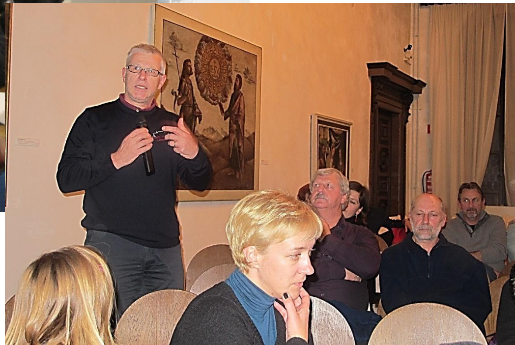
Pogovorni večer o Tomosu