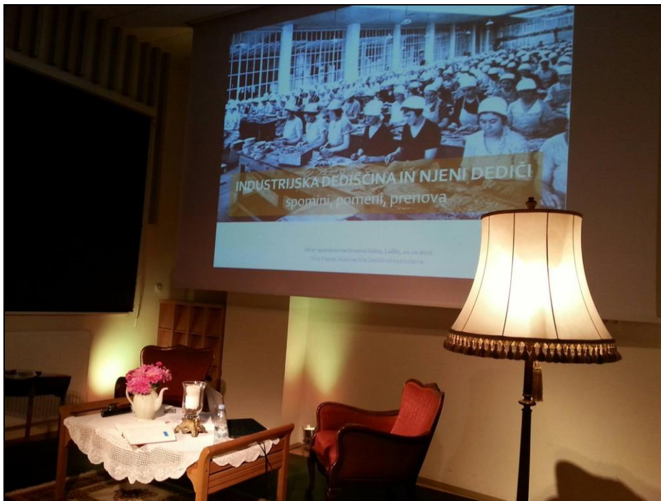
Slika 8: Scena kavarniškega večera

Izvedba kavarniškega večera o Volni Laško je bila namenjena zbiranju spominov in občutkov nekdanjih zaposlenih, njihovih družin in ostale lokalne skupnosti. Moja raziskava je povsem apolitična, želela sem samo razumeti ljudi. Vabilo je bilo namenjeno nekdanjim delavcem kot tudi širši lokalni skupnosti. Preko druženja in skupne debate smo se želeli seznaniti s pomenom dediščine tekstilne tovarne, ki ji ga pripisuje lokalno prebivalstvo. Dediščina so vse dobrine in artefakti, v katerih se prepoznavamo. Dediščina Volne Laško je s strokovnega vidika povprečna, je pa z vidika delavcev nenadomestljiva. Objekti Volne so fizični pomniki nekega kolektivnega spomina. Ko izgubimo te ljudi, nato pa še stavbe, spomin izgine.