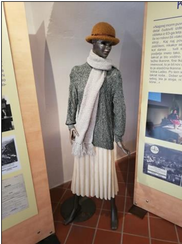
Slika 21: Razstavljena oblačila