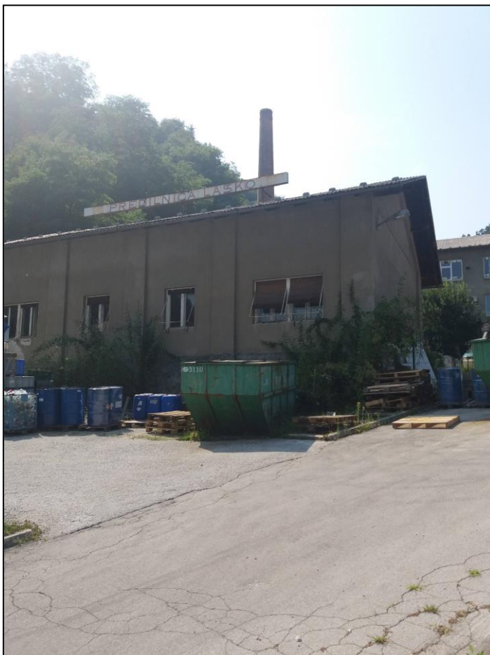
Slika 2: Tabla z napisom imena tovarne